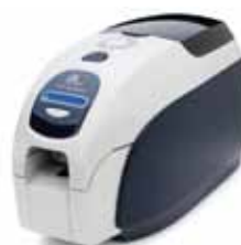
ZXP Series 3™ -Kartendrucker